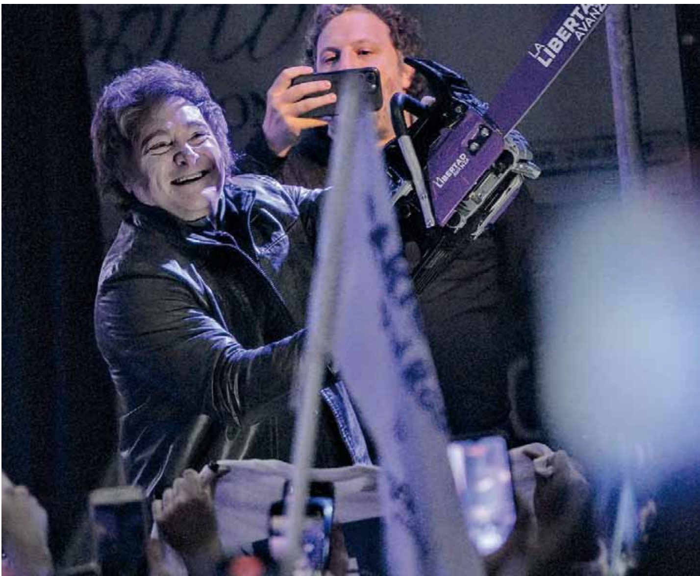
■ Motosierra. Un clásico que reapareció en medio del inicio del camino de las elecciones en Provincia.

prometido no insultar. Acusó al peronismo de convertir al distrito bonaerense en un "reducto de atraso". Vinculó al kirchnerismo con el empresario García Furfaro, dueño de HLB Pharma comprometido con la causa del fentanilo. Página 3