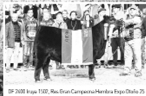
DF 2000 Inuya 1502, Ros. Gran Campeona Hembra Expo Otoño 25