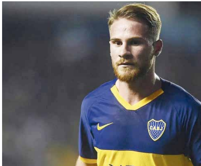
Primer golpe. El jugador del seleccionado calificó de ese modo su paso por el xeneize.

El episodio revela, además, un costado menos romántico del actual vicepresidente de Boca. Mien-