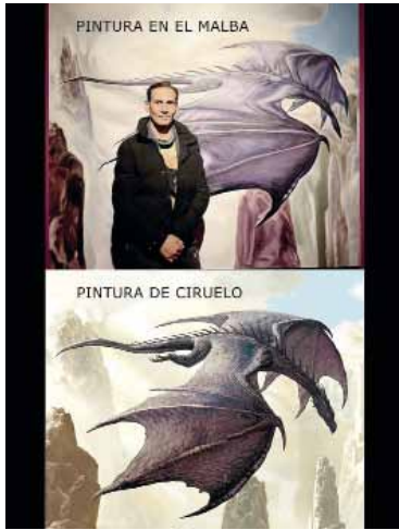
La publicación de Ciruelo.

Ciruelo denunció "plagio" por una obra en el Malba