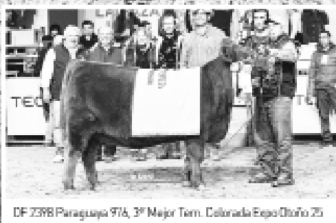
DF 2398 Paraguará 916, 3º Mejor Tern. Colorada Expo Otoño 25

VAQUILLONAS PC Y MAS PRENADAS Negras y Coloradas