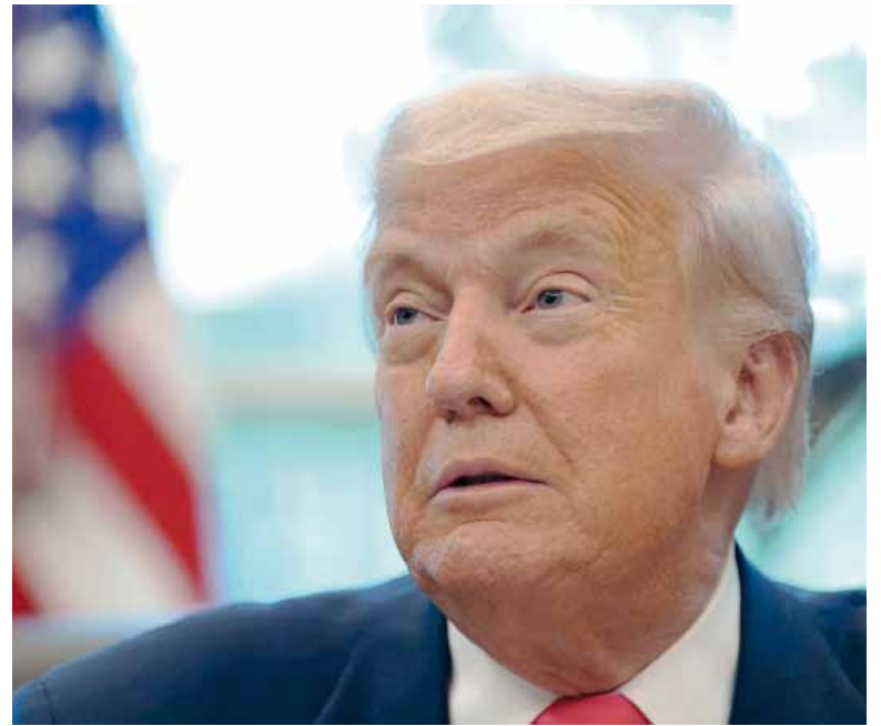
Primer cara a cara. Trump se reunirá por primera vez con Putin desde el inicio de la guerra.

Si el encuentro de hoy abre una puerta hacia un alto el fuego, Trump buscará capitalizar el