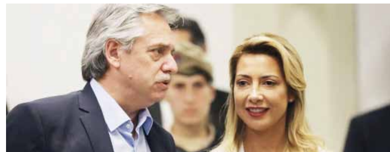
Acosos, hostigamientos. Algunas de las conductas que ejerció el expresidente descriptas por el fiscal.

Ramiro González dio por concluida la investigación y señaló que la acusación está basada en hechos ocurridos en una “relación asimétrica de poder”.