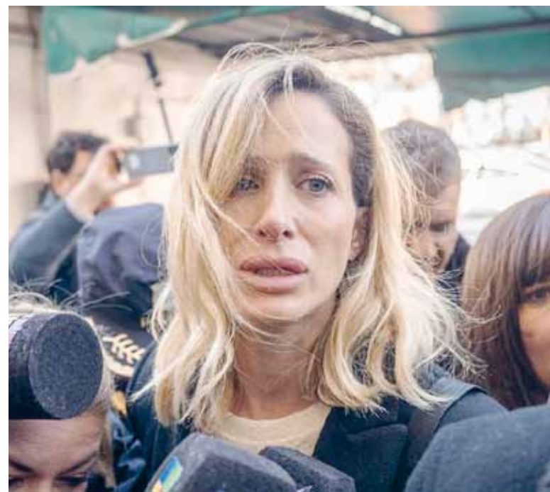
Por todas. "Esto es por mí y por todas aquellas víctimas de violencia de género", señaló la exmodelo.

Al intentar interceptarlo, el conductor emprendió la fuga y se