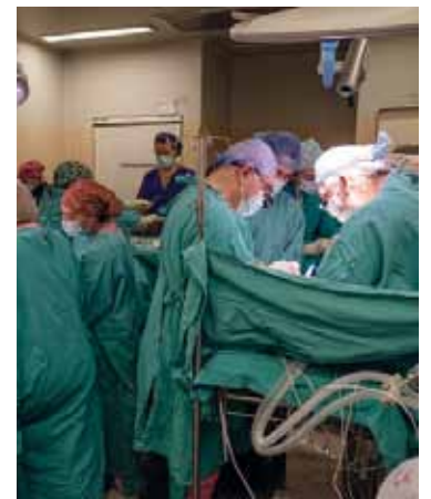
Los cirujanos y médicos en medio de la intervención.

Separan a siamesas gemelas unidas por el abdomen